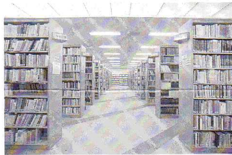
卒業生も本を借りられます

如何を問わず、延滞日数の貸出停止となりますので、ご注意ください。また、以後の来館時には一般利用者としてカウンターにて、氏名、来館・退館時間を記入してください。 ※閲覧室が満席の時と試験期間中は利用できません。また、臨時休館、開館時間の変更がありますので、ご利用の際は図書館(☎0792-23-6506)にお問い合わせください。